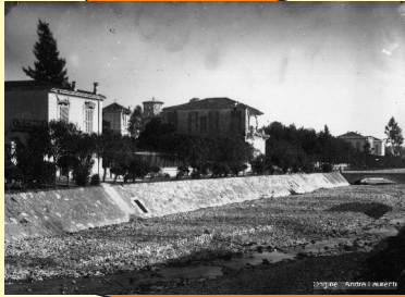
Tremblement de terre de Ligurie du 23 Février 1887 À Menton (France) : Intensité VII