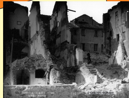
Tremblement de terre de Ligurie du 23 Février 1887 À Diano Marina (Italie) : Intensité X